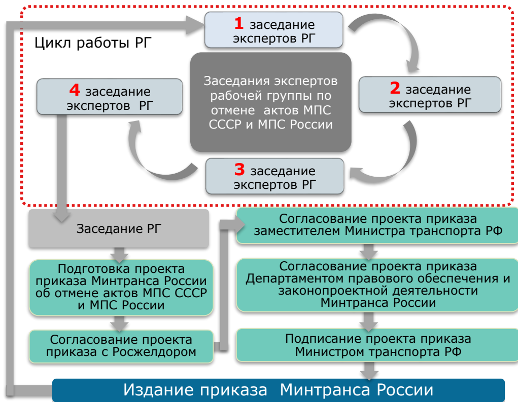
СХЕМА ОРГАНИЗАЦИИ РАБОТЫ РГ В МИНТРАНСЕ РОССИИ